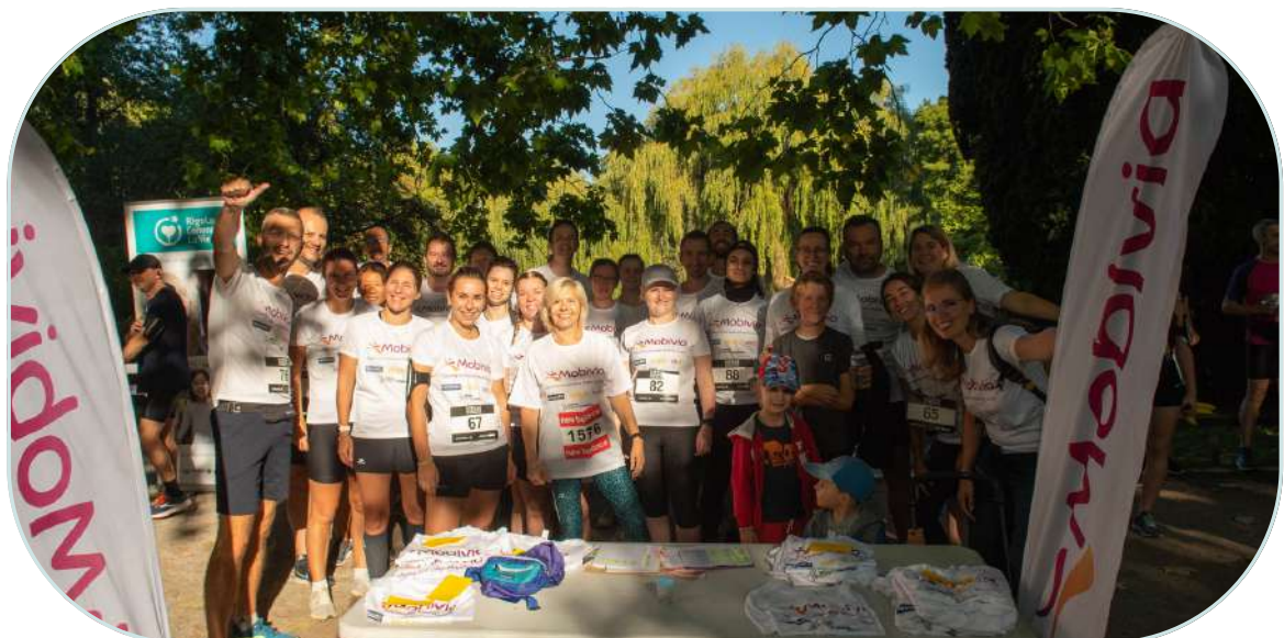
Les gagnants des Foulées 2022, IdKids, Mobivia, Solidarité