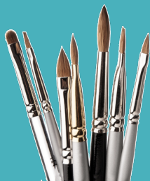
PINCEAUX et autre matériel