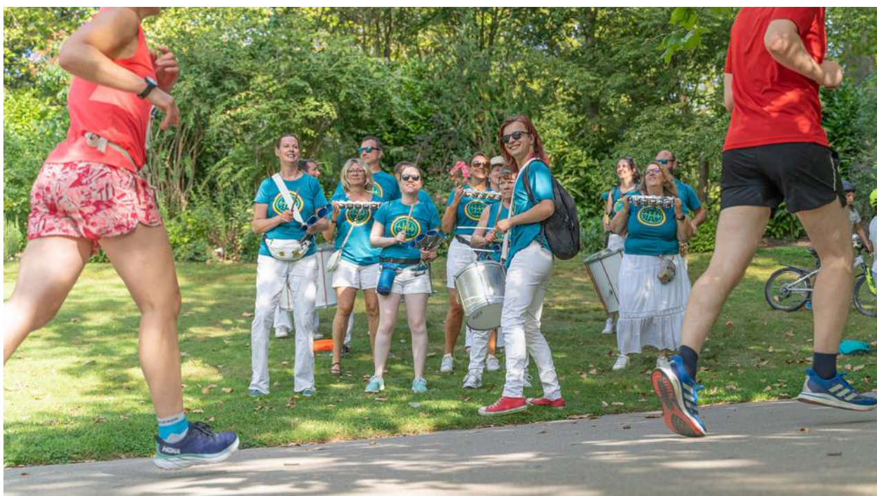
@Atabak, École de samba lilloise

Pour les entreprises, c'est une réduction d'impôt de 60 % du montant du don (hors inscriptions) qui s'applique quel que soit le régime fiscal (IS ou IR), dans la limite d'un plafond de 5 % du CA annuel.