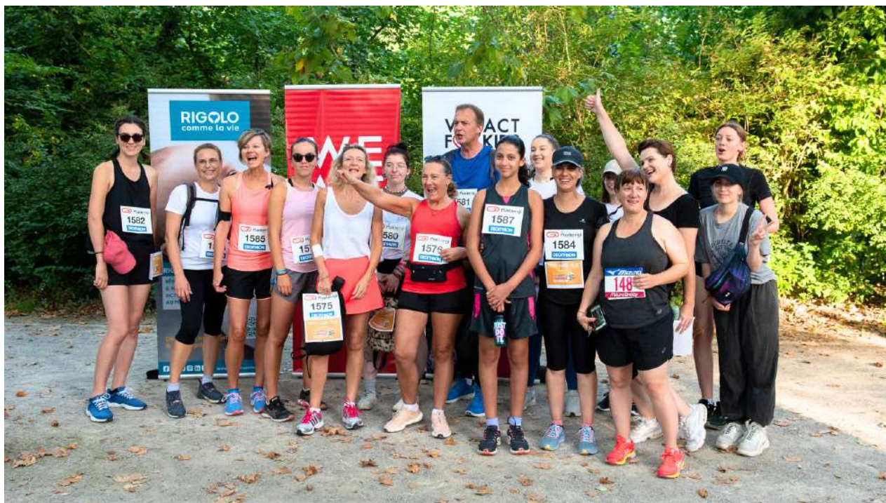
Les gagnants des Foulées 2023 : ïdKids, Solidarité, Mobivia