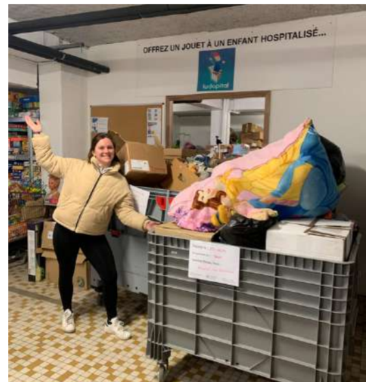
@Hôpital des nounours

Communiquez auprès de votre communauté et mentionnez Ludopital sur les réseaux sociaux.