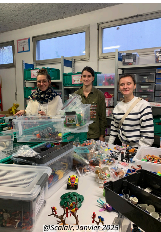
@Scalair, Janvier 2025

Une journée d'action solidaire est une journée où le monde de l'associatif et celui de l'entreprise se rencontrent pour répondre aux besoins différents des deux parties.