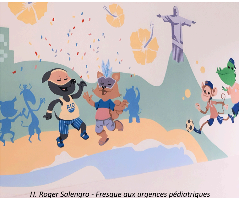
H. Roger Salengro - Fresque aux urgences pédiatriques