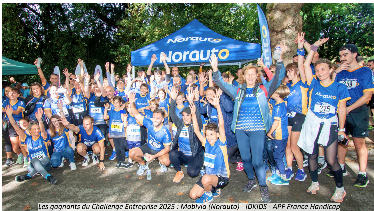
Les gagnants du Challenge Entreprise 2025 : Mobivia (Norauto) - IDKIDS - APF France Handicap