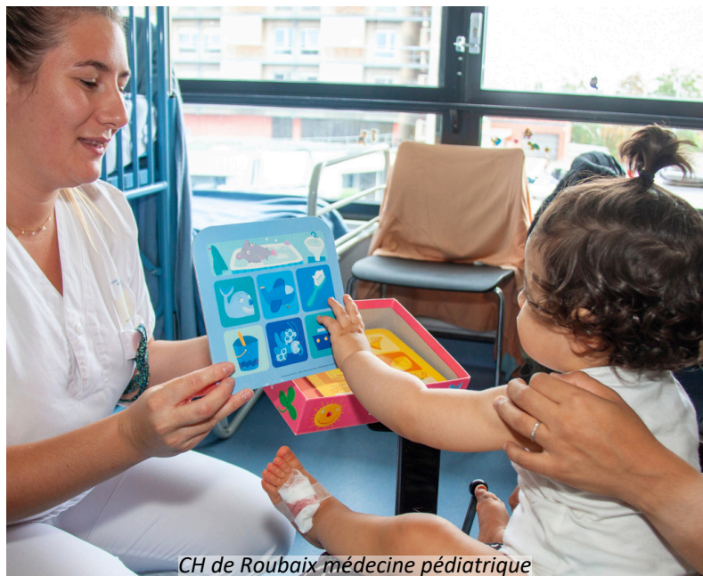
CH de Roubaix médecine pédiatrique

DEPUIS 1987, LUDOPITAL ŒUVRE POUR CETTE CAUSE D'INTÉRÊT GÉNÉRAL : LE BIEN-ÊTRE DES ENFANTS LORS DE LEUR SÉJOUR EN MILIEU HOSPITALIER.