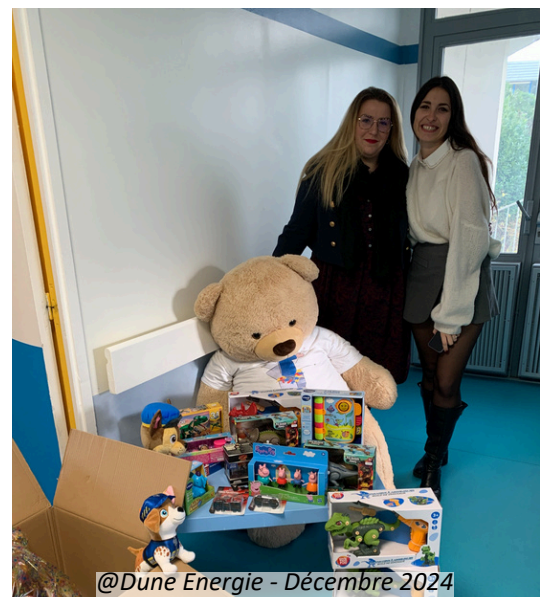
@Dune Energie - Décembre 2024

Communiquez auprès de votre communauté et mentionnez Ludopital sur les réseaux sociaux.